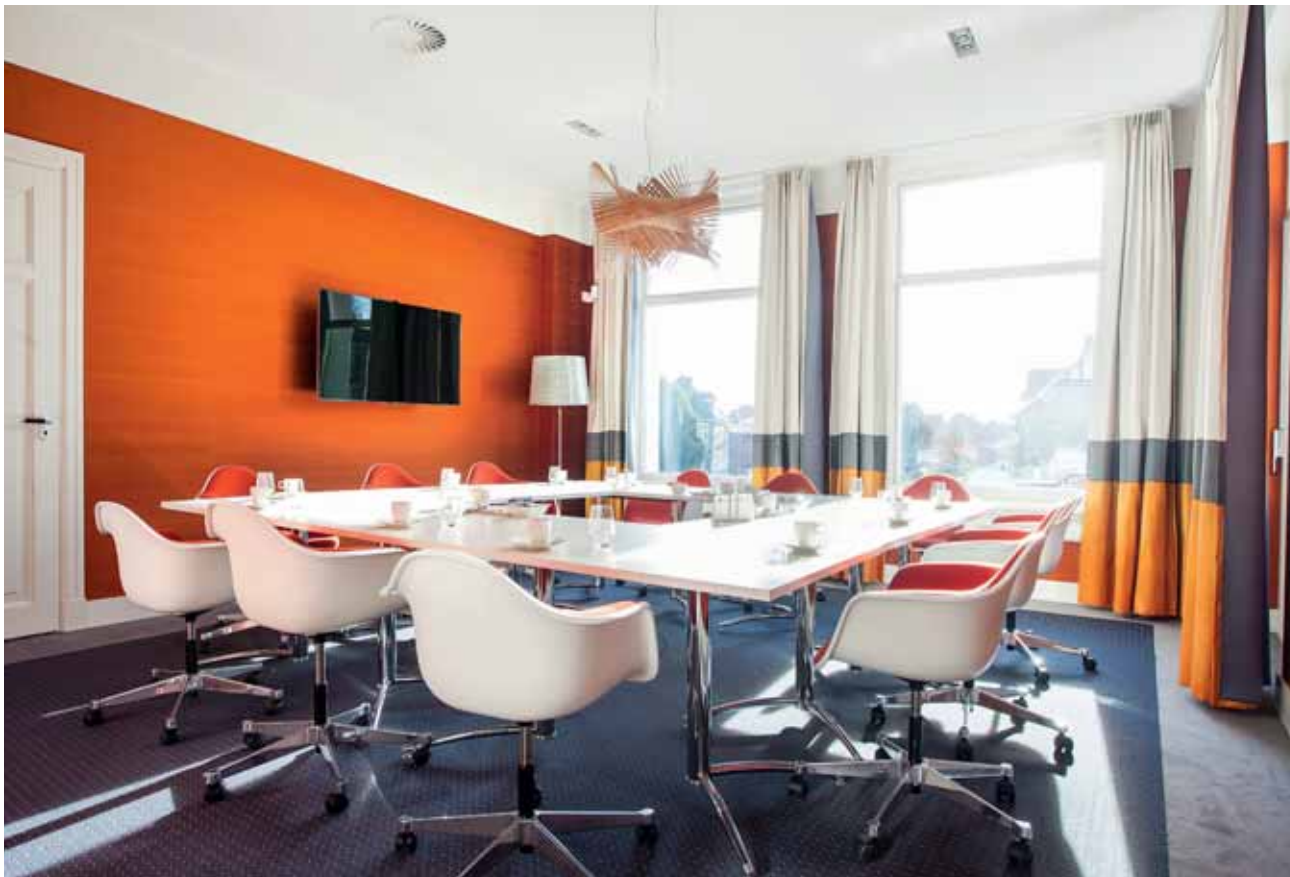
FOTO BOVEN Ruimtelijk werkende, horizontale kleurbanen op de gordijnen onderstrepen de architectuur van de villa.